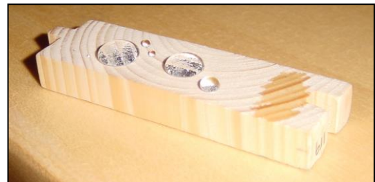
(Rechts: Wasser perlt an der Oberfläche ab. Das Holz schmutzt deutlich weniger ein, und ist einfacher zu reinigen)