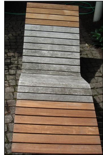
(Die Wirkung von Teak Refit am Beispiel einer Gartenliege aus Teakholz. Ohne Schleifarbeiten wurde der ursprüngliche Teak Farbton innerhalb von 3 Stunden wiederhergestellt)

Im ersten Arbeitsgang wird Nanoprotect-Teak Refit mit einer Bürste flächendeckend aufgetragen und nach ca. 2 Stunden mit viel Wasser abgespritzt. Im zweiten Arbeitsgang kann Nanoprotect-Antgra oder Nanoprotect-Teakdeckschutz zur bestmöglichen Konservierung aufgebracht werden.