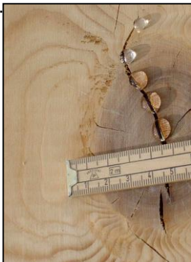
(Links: Selbst Risse bis 2mm werden durch den extrem wasserabstoßenden Effekt überbrückt)

Nanoprotect-Teakdeckschutz AB hat identische Eigenschaften wie Nanoprotect-Teakdeckschutz, verleiht der Imprägnierung jedoch durch ein Silberadditiv ein pilz- und schimmelwidriges Verhalten. Diese hygienische Variante ist für Oberflächen geeignet die auf Grund von regnerischen Umgebungsbedingungen mit Moos- und Algenbildung zu kämpfen haben. Weiterhin wird die Entstehung von schwarzen Flecken reduziert. Der Auftrag von Nanoprotect-Teakdeckschutz AB lässt die Oberflächen leicht nachdunkeln.